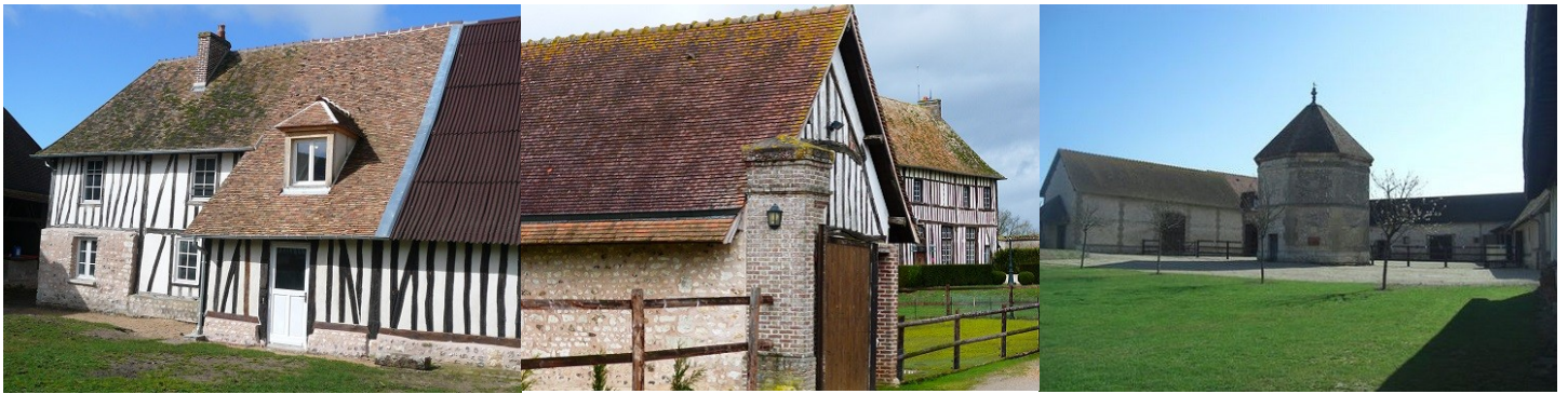
Vue de l'ensemble du monument